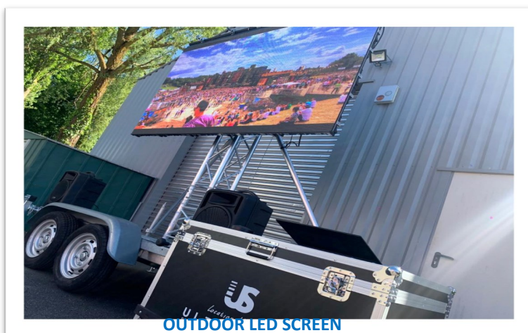
OUTDOOR LED SCREEN