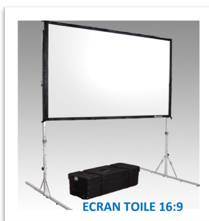
ECRAN TOILE 16:9