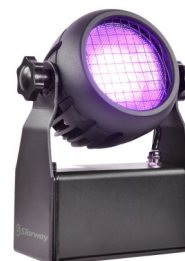
Floodlight mono blinder