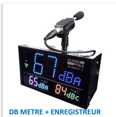
DB METRE + ENREGISTREUR