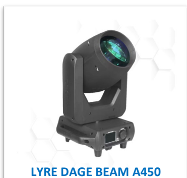
LYRE DAGE BEAM A450