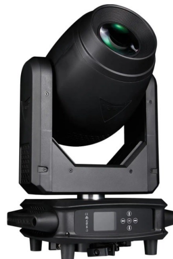
BSW LED 250W