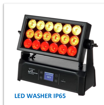
LED WASHER IP65