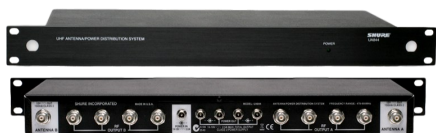
Répartiteur antenne SHURE