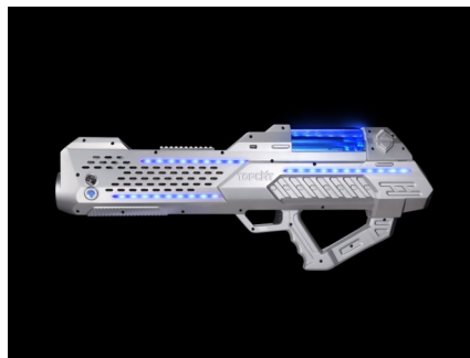
ULTRA FOG-GUN Co2